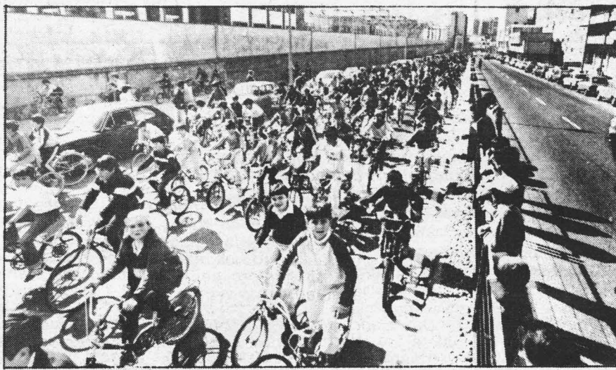
A Dirección Xeral de Tráfico ven de convocar o "III Concurso de Educación Vial Escolar".

As funcións que desempeñará o Consello Escolar en relación ó comedor serán: fixar criterios para a formación do persoal colaborador, a proposta do director, designar e separa-lo encargado do comedor e persoal colaborador; seleccionar, nomear e separa-lo persoal laboral, ademais de aproba-los presupostos presentados pola Comisión Económica, que será a encargada de alegalos, así como